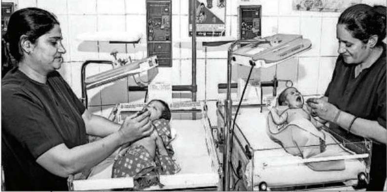
जयपुर में मंगलवार को अंतरराष्ट्रीय नर्स दिवस के अवसर पर नवजात शिशुओं की देखभाल करती नर्स।