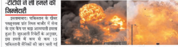
आत्मघाती हमले की जिम्मेदारी ली है। संघर्ष में अधिकारिक बयान जारी कर कहा कि यह हमला उनकी संरक्षित इस्लामाबाद फौज का हिस्सा था।

इस्लामाबाद। पाकिस्तान के खैबर पख्तूनख्वा प्रांत स्थित बाजोर में सेना के एक कैंप पर बड़ा आत्मघाती हमला हुआ है। घुसराती रिपोर्टों के अनुसार, इस हमले में कम से कम 15 पाकिस्तानी सैनिकों की जान चली गई है। आतंकीयों ने इस हमले को एक सोवियत-समर्थी आतंकी के तहत अंजाम दिया।