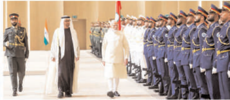
(एलपीजी) की आपूर्ति सुनिश्चित करने के लिए महत्वपूर्ण समझौता ज्ञान (एमओयू) पर हस्ताक्षर किए गए।

अबु धाबी पहुंचने पर यूएई के राष्ट्रपति मोहम्मद बिन जयद अल नाहयान ने उनका भव्य स्वागत किया। यूएई राष्ट्रपति ने एफ-16 लड़ाकू विमानों से प्रधानमंत्री मोदी के विमान को एकलकट किया, जिसे प्रधानमंत्री ने भारत के लिए सम्मान बताया। इस दौर के दौरान दोनों नेताओं के बीच कई प्रतिनिधिमंडल स्तर की वार्ता में रक्षा, ऊर्जा, निवेश और समुद्री सुरक्षा जैसे कई अहम मुद्दों पर सहमति बनी। भारत और यूएई के लिए एक नए फ्रेमवर्क पर सहमति जताई। इसके अलावा एणनीतिक पेट्रोलियम रिजर्व स्थापित करने तथा भारत को लिक्विडाइड पेट्रोलियम भंडार